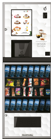
LEI300 + ARIA S

LEI300 je automatický vendingový stroj pro horké nápoje s kapacitou 300 kelímků s elegantním designem řady LEI. V kombinaci se spirálovým automatem ARIA S přichází se zcela novými možnostmi prodeje. Tato sestava je ideální pro střední a malé provozy.