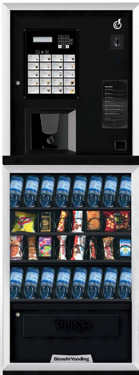
LEI300 SMART + ARIA S SLAVE