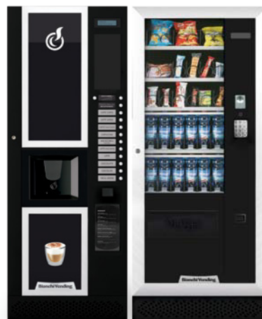
LEI400 + ARIA M MASTER